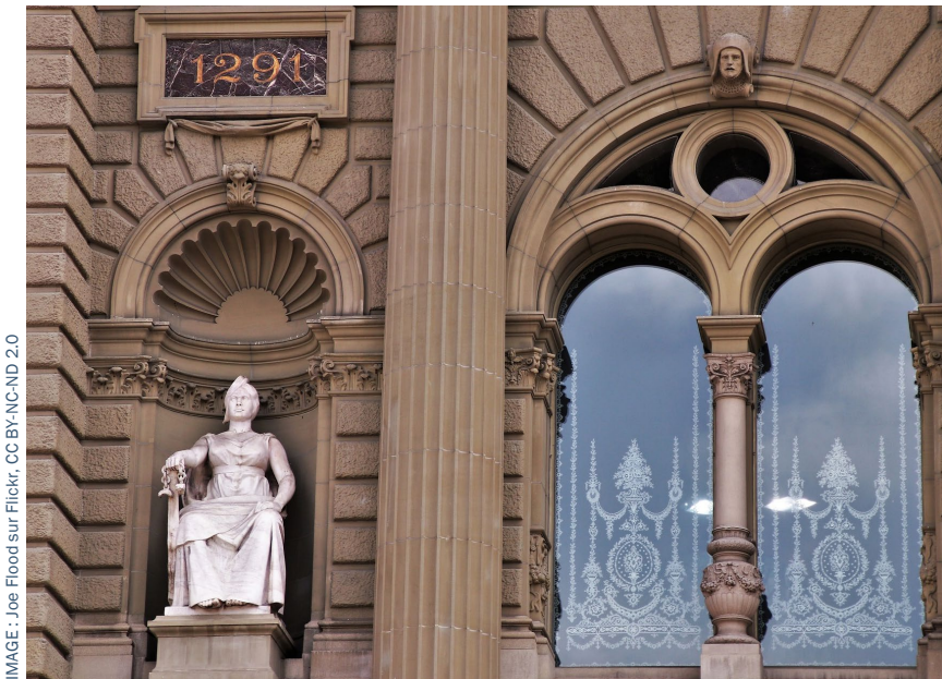
La torture n'est toujours pas officiellement punissable en Suisse. (image : palais fédéral à Berne)

Suisse, disposait d'un budget de 1 113 413 francs en 2021, budget qu'elle avait pourtant déclaré être insuffisant pour mener à bien sa mission. L'INDH devra s'occuper de l'ensemble des droits humains en Suisse. EC