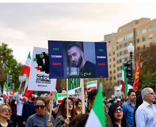
Démonstration en Iran, le 12 novembre 2022

Les autorités iraniennes utilisent la peine de mort comme outil de répression politique dans le but de terroriser la population et de mettre un terme au soulèvement populaire. Selon la liste disponible au moment de la rédaction, les individus suivants ont été condamnés à mort :