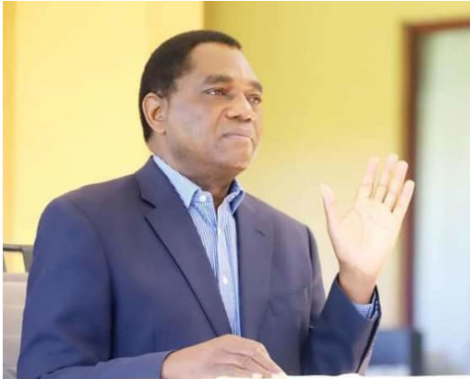
Hakainde Hichilema, président de la Zambie, a signé le 23 décembre 2022 un décret abolissant la peine de mort. (Photo de 2021)